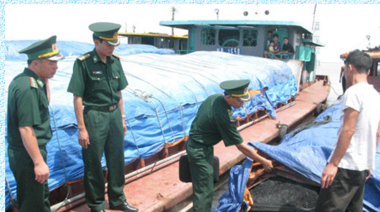
Kiểm tra tàu trở hàng hoá trái phép

Theo Điều 12 Nghị định số 137/2004/NĐ-CP, việc xử phạt các hành vi vi phạm trong